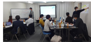
過去のバイオデザイン・ワークショップ

ワークショップでは講義とワークを通じて、バイオデザインの基となっているデザイン思考、現場におけるニーズの見つけ方、ニーズステートメントの作成方法、ブレインストーミングによるアイデア創出方法など Identify と Inventフェーズを中心に体験いただけます。本ワークショップを通じて、 現場のニーズを捉えた商品・サービスの開発の全体像を設計できるようになります。 様々な業種の方のご参加をお待ちしております。