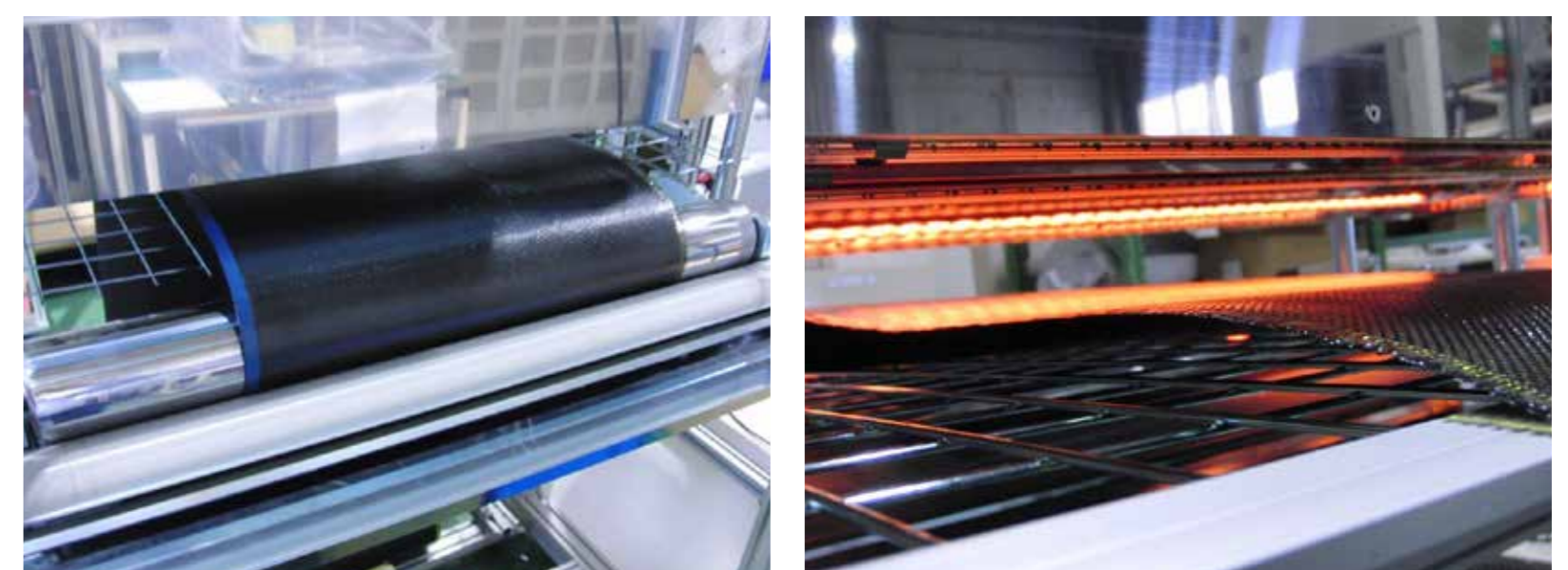
熱可塑性プリプレグの加熱部の断面図