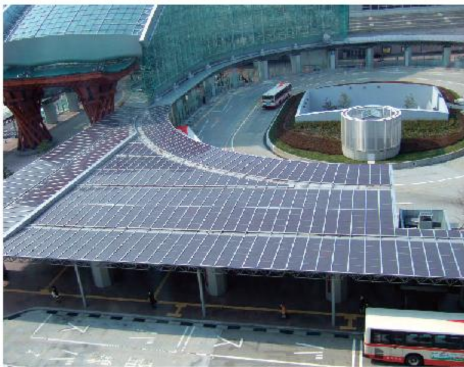
金沢駅東広場(石川県金沢市)