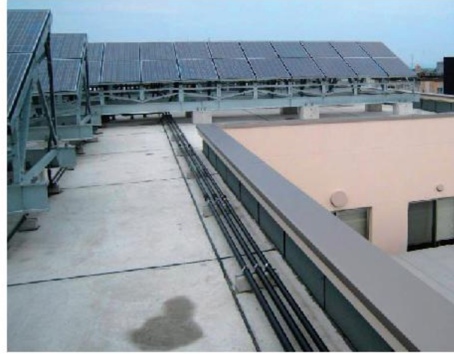
入善まちなか交流施設うるおい館(富山県入善町)