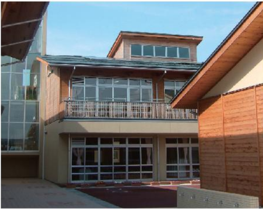
春江東小学校(福井県坂井市)